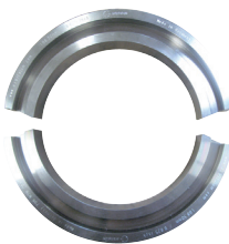
Aluminium-Spannschale zu RPG 8.6