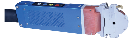
OW 12 mit schmaler Spannkassette (Typ "A")

Spannkassetten und Spanneinsätze sind nicht im Lieferumfang enthalten (siehe ab Seite 23).