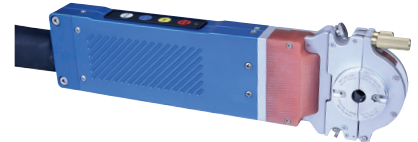
OW 12 mit breiter Spannkassette (Typ "B") und wechselbaren Spanneinsätzen