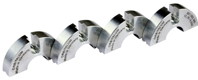
Spanneinsätze zu OW 12, Typ "B" (breit), 4tlg.