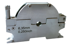
Spannkassetten zu OW 12, Typ "A" (schmal)

Aus Edelstahl mit aufklappbarer Abdeckung "FlipCover" - ermöglicht die Kontrolle und ggf. Nachjustierung der Elektrodenposition vor dem Schweißvorgang. Für das Schweißen von Mikrofittingen und andere Anwendungen mit sehr begrenzten Einspannlängen sind Spannkassetten mit einer Gesamtbreite von nur 12,2 mm (0.48") lieferbar (Typ "A"). Bei Typ "A" wird für jeden Rohrdurchmesser eine separate Spannkassette benötigt.