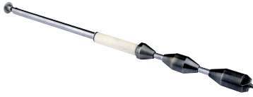
Aufnahmedorn TX 38P